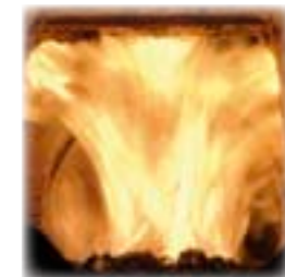
Detalle quemador en funcionamiento

Accesorios, silos y transporte de combustible (ver página 56)