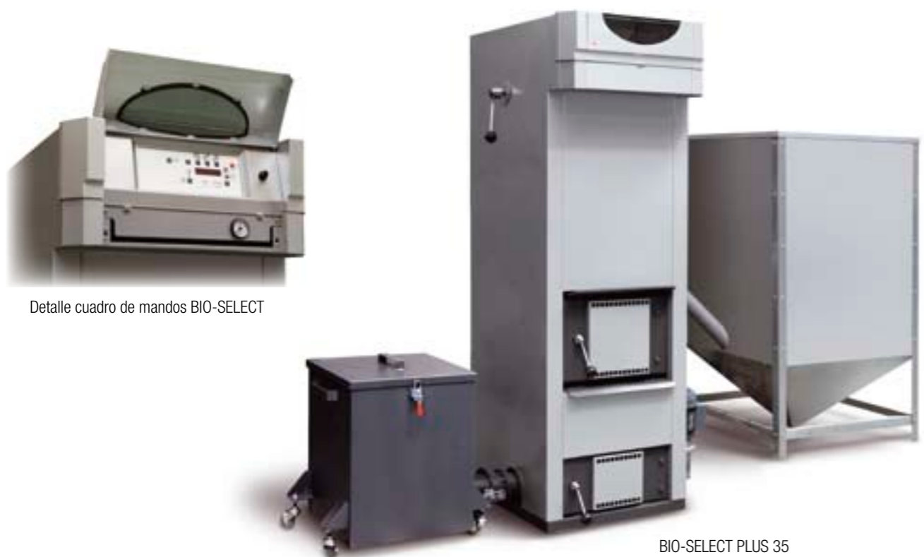
BIO-SELECT PLUS 35

CALDERAS DE ACERO PARA COMBUSTIBLES DE BIOMASA