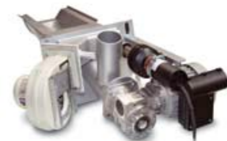
Detalle quemador BIO-SELECT PLUS