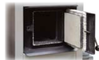
Detalle puerta cámara de combustión